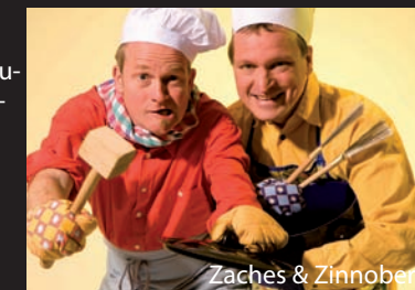
Zaches & Zinnober

Sa., 23.11., 17:30 Uhr Kindertheater, „Konzert am Herd“ mit Zaches & Zinnober Zaches & Zinnober kredenzen beim „Konzert am Herd“ ein musikalisches Menü zum Zungenschnalzen und Fingerlecken! Ort: Grundschule Wissingen, Niemandsweg 4, Bissendorf / Wissingen, Eintritt: Kinder 5 €, Erwachsene: 7 €